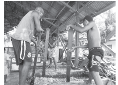
カカオ豆を発酵箱でかき混ぜる

カカオ豆がチョコレートになるまでには、長い加工プロセスをたどることになりますが、まずは、カカオの種を発酵・乾燥させてカカオ豆にして出荷するところまでを自分たちで開始しました。ところが、これまで自然の中で自由に生きてきたパプア人の多くは「労働をする」ということに慣れていません。集荷スタッフたちは、時間管理をされて働くことに慣れるのが大変だったようです。生産者については、品質のよい豆を出すことを理解するまでに一苦労。よい商品を作っていくということ、初めから一つひとつ学んでいくことの始まりです。2012年から始まったこのパプアでのカカオ事業は、今年で3シーズン目を迎えます。これまでの課題を振り返り、どう改善できるか話し合いがもたれています。どんなカカオが日本に届くか、彼らの奮闘に寄り添っていきたくと思っています。