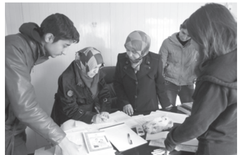
母子保健に関するパンフレットを作成中