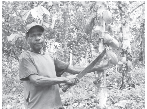
一つひとつ手作業でカカオの実を収穫する

JIM-NETは福島支援の一環として、(特活)APLA、(株)オルター・トレード・ジャパン、(特活)アークス仏教国際協力ネットワークとともにパプアのカカオを使ったカカオクッキーを作るプロジェクトを企画しました。昨年の秋から、福島県いわき市の福祉作業所で製造を開始しています。このクッキーの売り上げの一部は福島における支援活動費となります。ご協力ください。皆様のお申込を心よりお待ちしております。