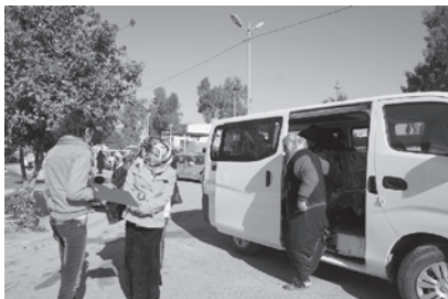
公立産科病院に到着した医療バス

シリア難民妊産婦支援プロジェクトにおける一つ目の活動は、妊婦さんが医療機関へアクセスできるように、キャンプから公立産科病院まで医療バスを配備することです。2014年2月から、バスの運行が開始しました。第一弾のバスには、早急に妊婦健診が